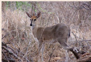
Duiker, Grey/Duiker, Grimm's (Common)