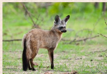
Øreræv/Bat Eared Fox