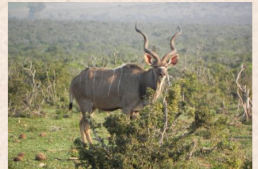
Kudu, East Cape