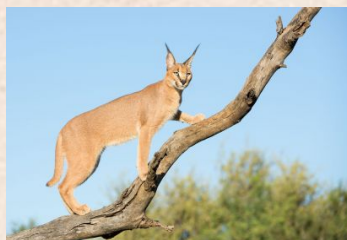
Ørkenlos, Caracal (Afrika)