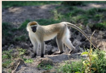
Grøn Marekat, Vervet Monkey