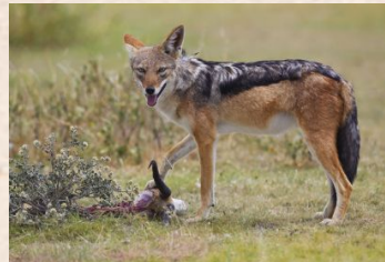
Sjakkal, Skaberaksjakkal/Black- backed Jackal